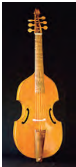
Viola da Gamba bajo inglesa. Según John Rose (c. 1600. Victoria & Albert Museum) 6 cuerdas Tabla armónica en siete piezas dobladas. Tiro: 710 mm. Precio: 8.500 €