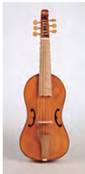
Viola da Gamba soprano Según G. M. da Brescia (c. 1575) 6 cuerdas Tiro 320 cm. Precio: 3.200 €