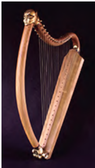
Arpa Pórtico de la Gloria 19 cuerdas. Afnación: Sol - re' ' Precio: 3.600 €