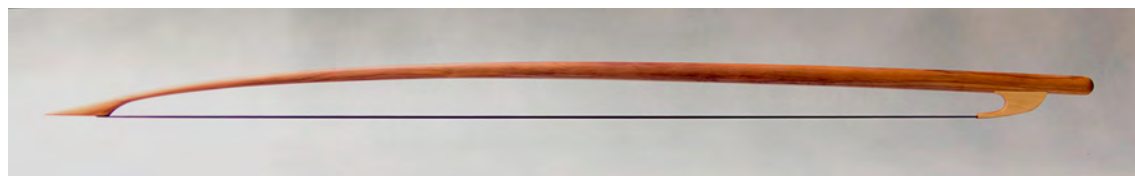
Arco de viola bajo

Longitud total aproximada: 800 mm; peso: 78- 82 gr; crin: 650 mm.