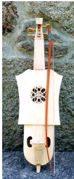
Violeta de Santa Catarina de Vigri (1433-1435) Cuatro cuerdas Tiro: 305 mm. Precio: 3.000 €