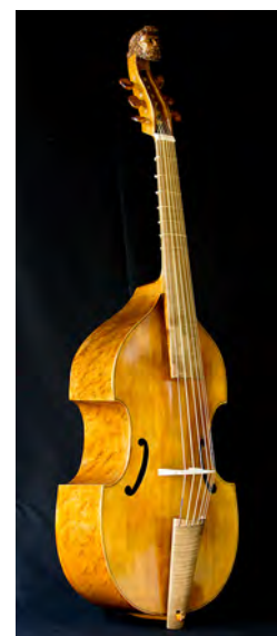
Viola da Gamba Tenor. Según J. Rose 1598 6 cuerdas Tiro: 580 mm. Precio: 5.500 €