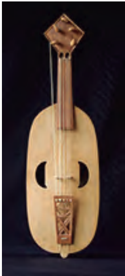
Vyola Pórtico de la Gloria (Catedral de Santiago s. XII) Tiro 320 mm. 5 cuerdas (1 bordón). Precio: 2.800 €