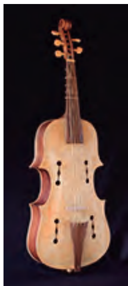
Violón Ibérico. Según original( Monaste- rio de la Encarnación Ávila), S. XVII (atribuido a Domingo Pescador). 5 cuerdas. Cinco trastes. Tiro: 705 mm. Precio: 7.000 €