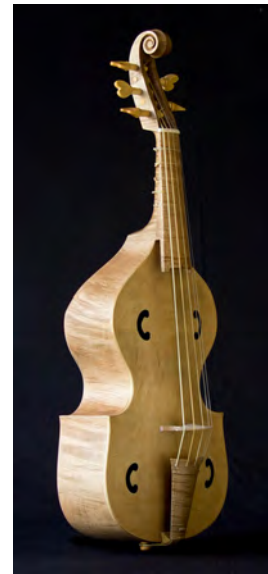
A partir del del cuadro "La Armonía" o "Las tres gracias" (Hans Baldung 1484/85-1545, Museo del Prado, Madrid). Tiro de 350 mm, cinco cuerdas y cinco trastes. Precio: 3.200 €