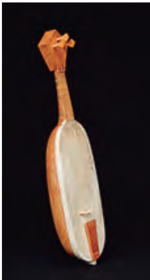
Laúd. Pórtico de la Gloria Tiro: 370 mm. 3 cuerdas. Tapa de pergamino. Precio: 2.500