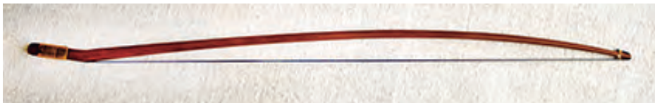
Arco para vyola grande: longitud 770 mm; peso: ± 84 gr.