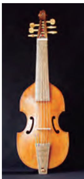
Viola da Gamba soprano. Según H. Jaye. 6 cuerdas Tiro: 360 mm. Precio: 3.500 €