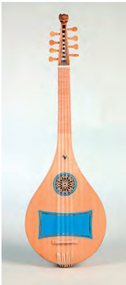
Mandora Según iconografía: Fra Angelico (Virgen de la Humildad, 1433-1435) Cuatro órdenes Tiro: 576 mm. Precio: 2.500 €