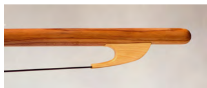
Nuez tensando las crines