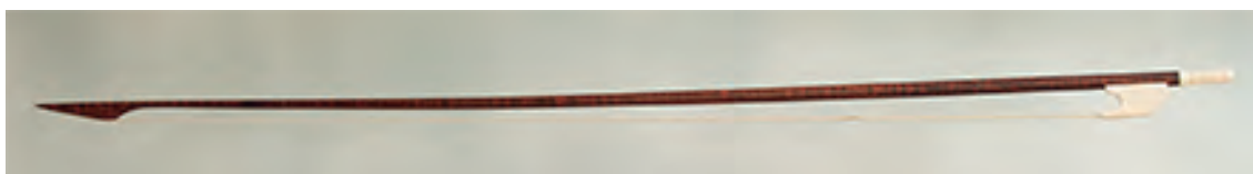
Arco de viola da gamba bajo

Longitud: 790 mm; peso: 95 - 98 gr; crin: 670 mm.