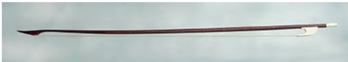
Arco de viola da gamba bajo

Longitud: 775 mm; peso: 90 - 94 gr; crin: 660 mm.