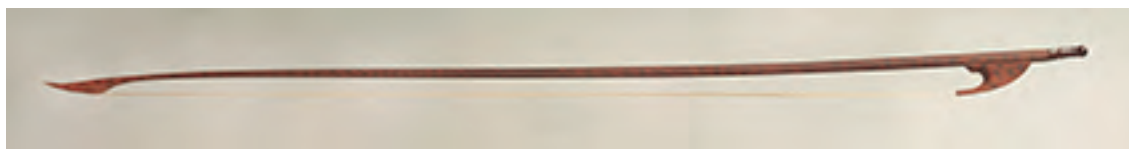
Arco de viola da gamba soprano

Longitud: 695 mm; peso: 48 - 50 gr; crin: 600 mm.