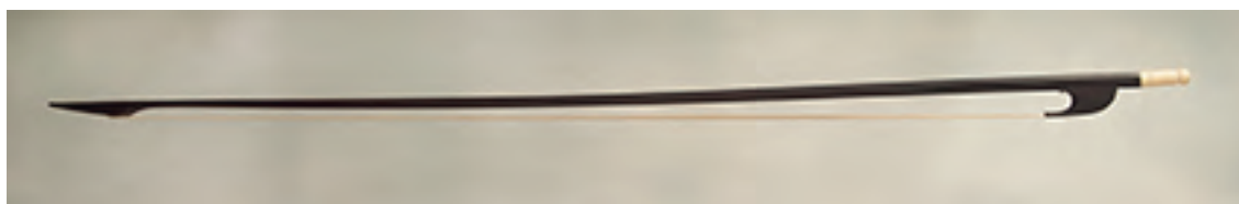
Arco de viola da gamba bajo

Longitud: 815 mm; peso: 97 - 100 gr; crin: 675 mm.