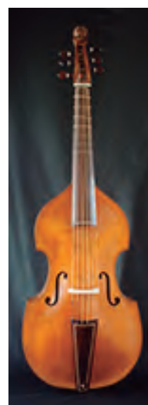
Viola da Gamba bajo alemana. Según Jacob Stainer (colección privada) 6 cuerdas Tabla armónica en dos piezas talladas. Tiro: 710 mm. Precio : 9.800 €