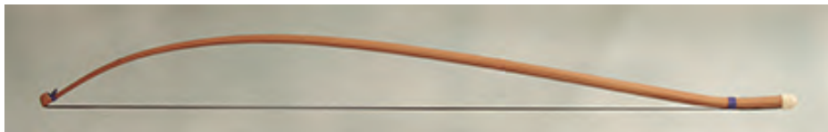
Arco de Vyola: longitud 770 mm; peso 50 - 60 gr.