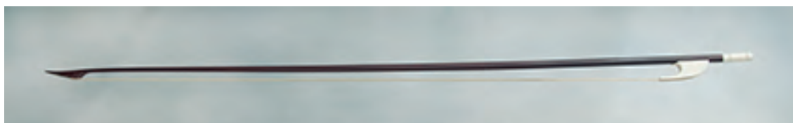
Arco de viola da gamba soprano

Longitud: 700 mm; peso: 50 - 54 gr; crin: 605 mm